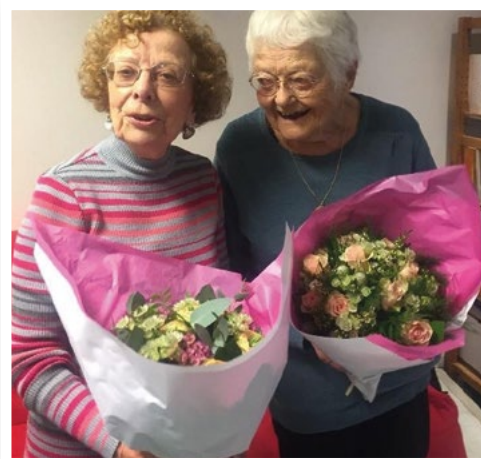
Le SNIA remercie ses fidèles bénévoles