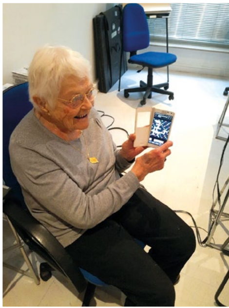
Une victoire au scrabble entre deux mises sous pli de bulletins.