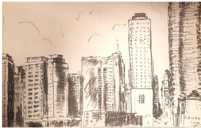
Croquis réalisé par Para lors du congrès mondial de Chicago en 2000.